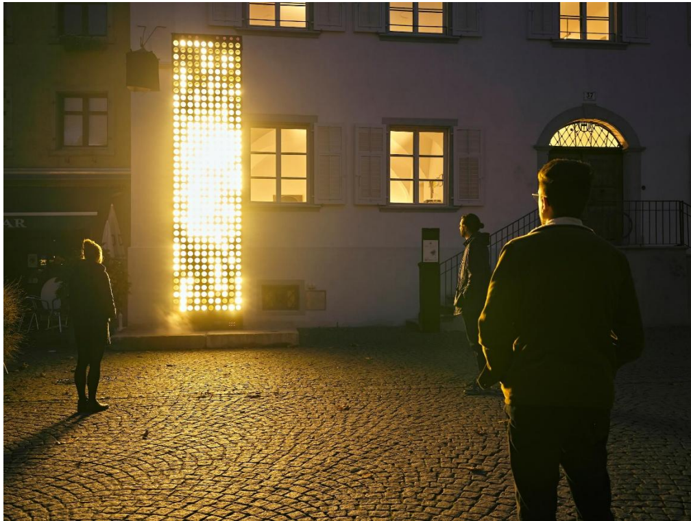
NEON GOLDEN: PORTAL, Spotlight 2020, Foto Miro Kuzmanovic