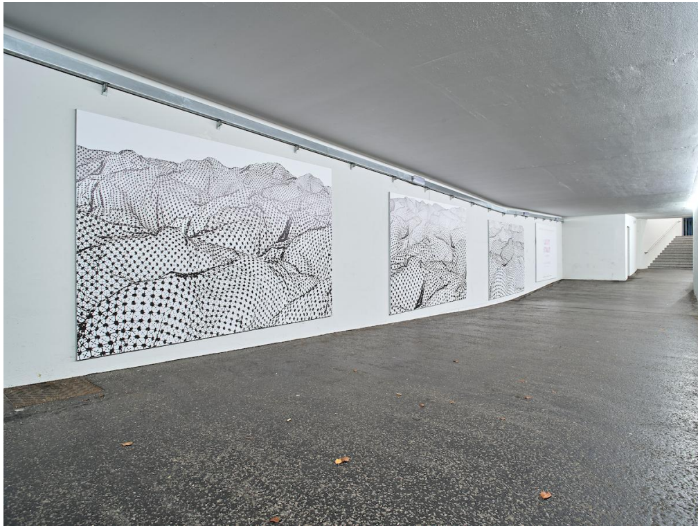
David Reumüller: Untitled, Spotlight 2020, Foto Miro Kuzmanovic