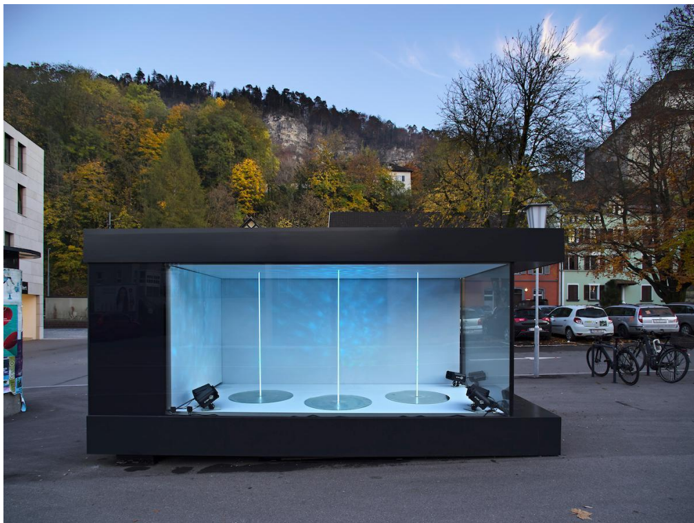
Miriam Prantl: Aquamarin, Spotlight 2020